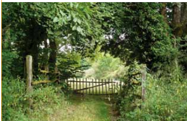
La Compagnie du Paysage