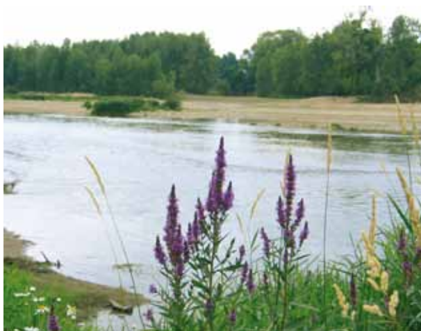
Loiret Nature Environnement