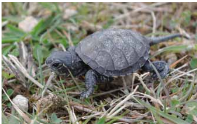
Sologne Nature Environnement